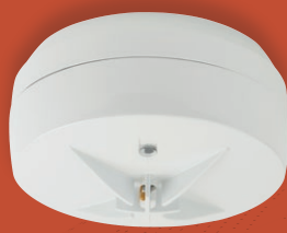
Detector termovelocimétrico 58°C convencional DTE-110