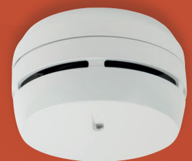
Detector óptico-térmico convencional DOTE-130