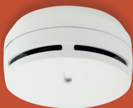
Detector óptico convencional DOE-120

Un sistema de alarma contra incendios debe detectar y notificar los incendios de manera segura y fiable, así como activar las salidas necesarias para evitar daños personales y materiales.